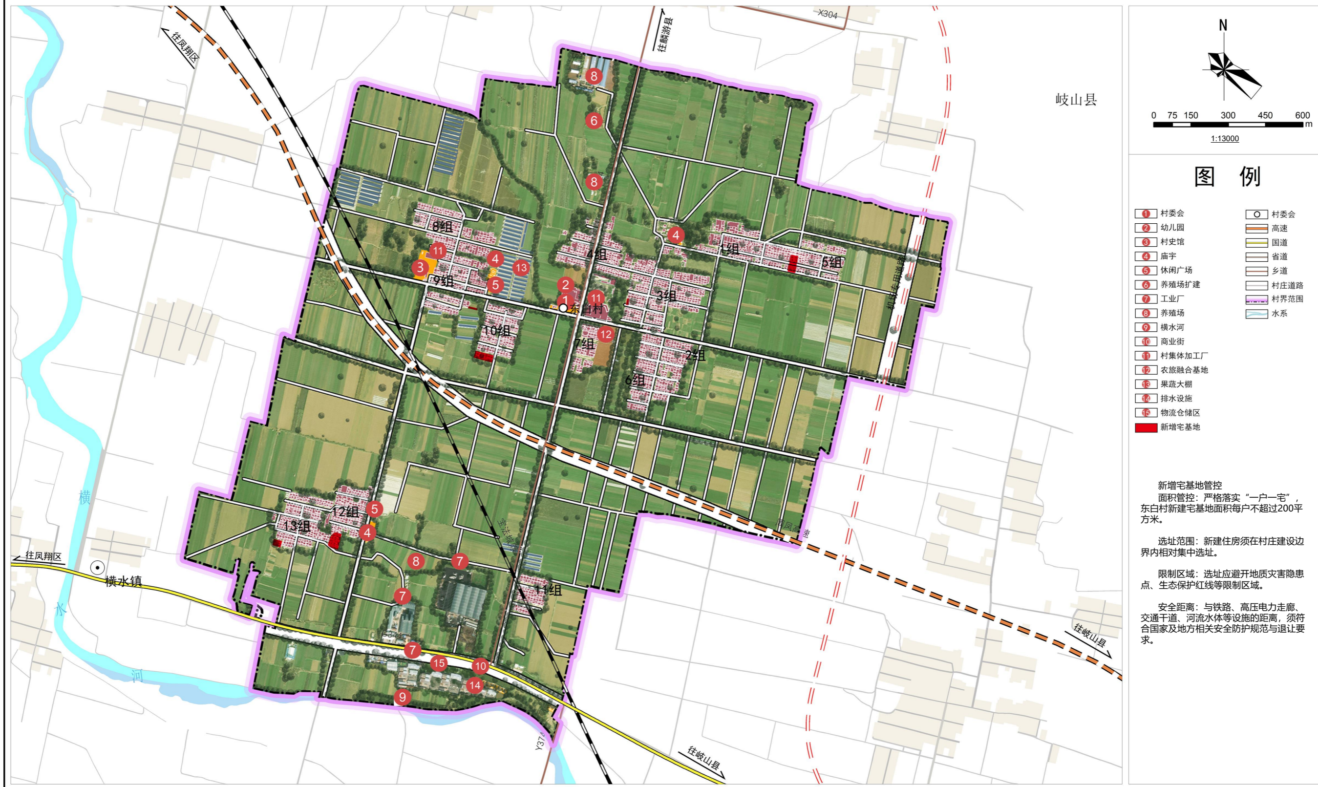
11 村庄建设总平面图